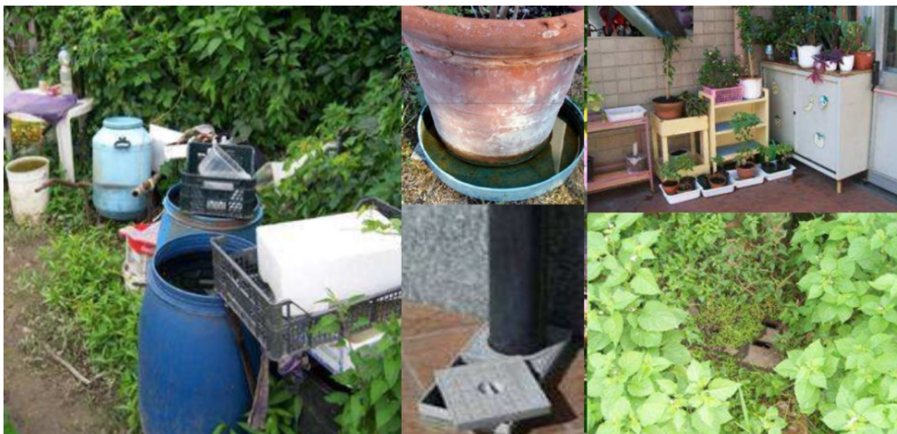
Alcuni esempi di focolai di sviluppo di zanzara tigre.

Abitazioni abbandonate, disordinate e manufatti incustoditi celano certamente focolai di zanzara tigre.