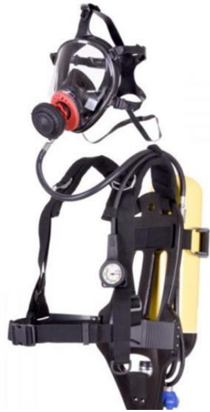
Autorespiratore RN Tipo 1 Con Maschera Intera TR2002/A SPASCIANI - (Senza Bombola)